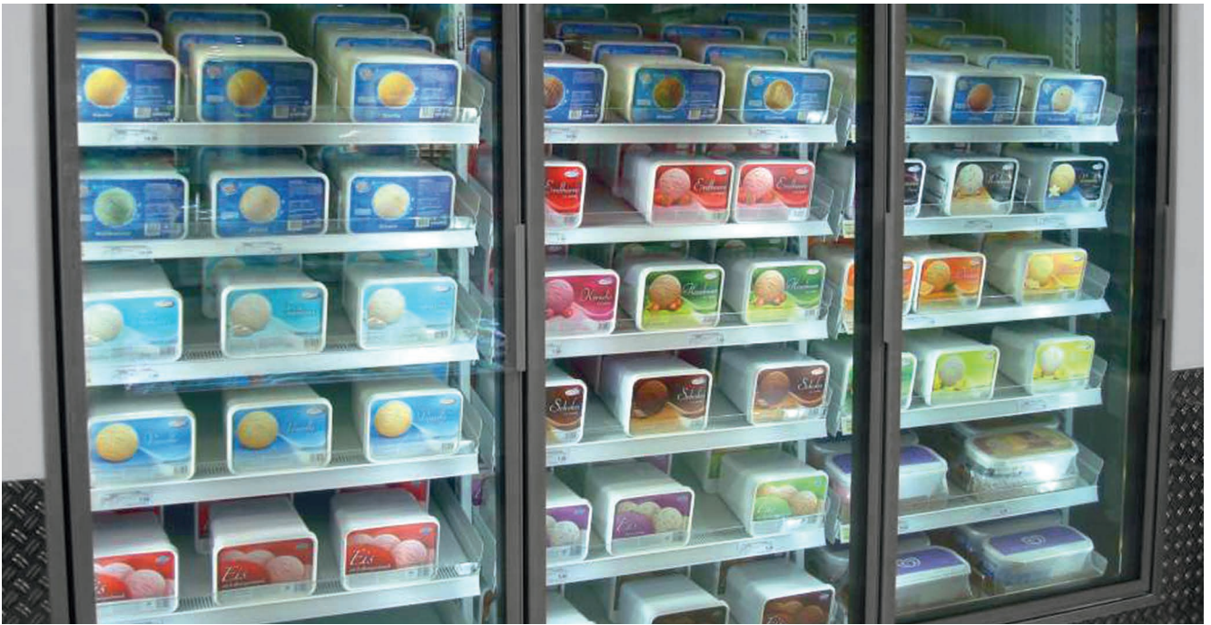
SCHOTT Termofrost® ECO-Clear est doté d'un revêtement anti-buée pour réduire la condensation visible.