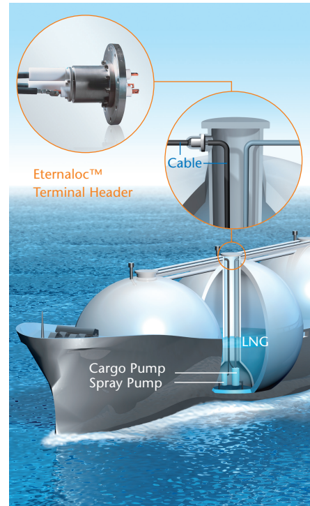
이터널락™ 터미널 헤더 육해상 설비에서 입증된 성능