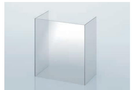
ROBAX® Glaskeramikscheibe | Winklig geformt, 2 Winkel

Die ROBAX® Produktlinie für Architekten ist ein definiertes Portfolio von Standardformen, perfekt geeignet für individuelle Kamin-Designer und Installateure (z. B. für Hotels, Restaurants, andere öffentliche Plätze und private Räume).