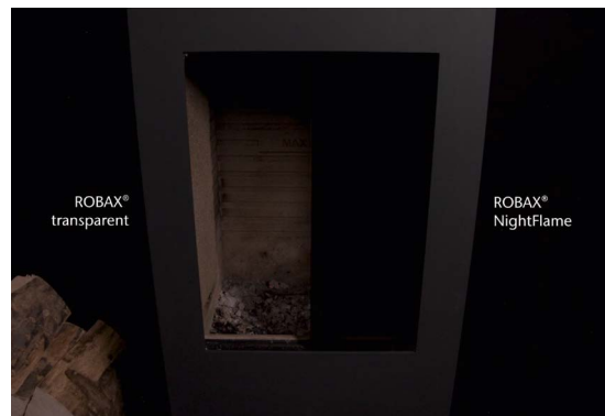
ROBAX® NightFlame und transparentes ROBAX® – Kamin im Aus-Zustand

Die Abbildungen zeigen den Unterschied von ROBAX® transparent direkt neben ROBAX® NightFlame in einem realen Ofenaufbau unter Laborbedingungen, jeweils mit geteilten Scheiben, d.h. links ROBAX® transparent, rechts ROBAX® NightFlame.