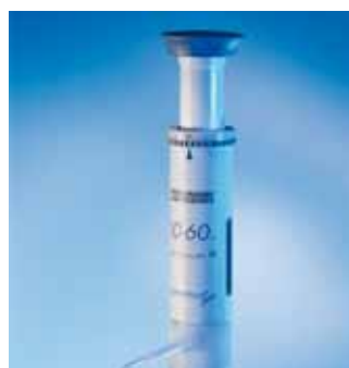
Appareil de dosage ceramus-classic