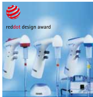
Appareils de pipetage

HOTLINE +49 (0) 7134 511-0 Le moyen le plus rapide d'accéder à un entretien profitable avec un spécialiste.