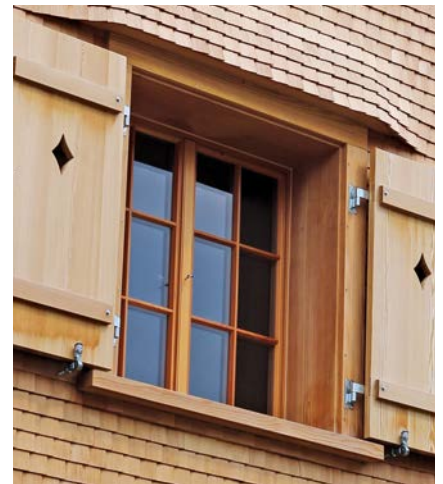
SCHOTT RESTOVER®-Fenster, Rahmen aus Lärchen-Holz, geölt