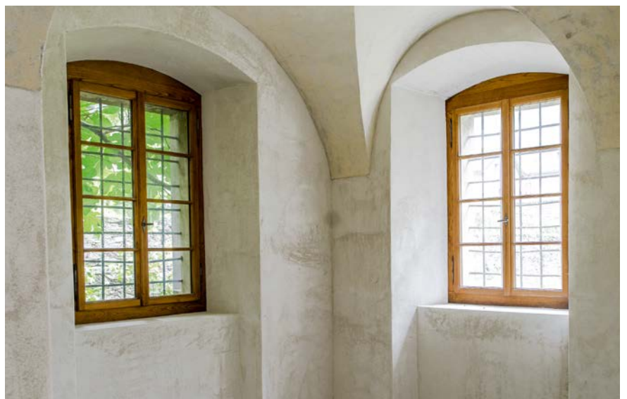
Restaurierung mit SCHOTT RESTOVER®, Rahmen aus Kastanien-Holz, geölt