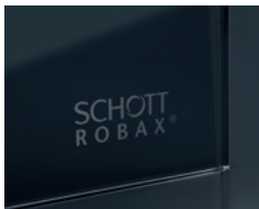
Logo in satin silver*