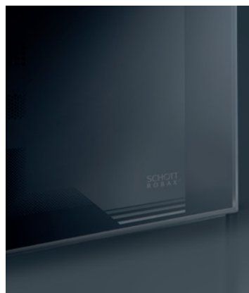
Rahmendekor in modern black und Logo in polar white und modern black gedruckt auf der Scheibennenseite