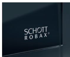
Logo in polar white*