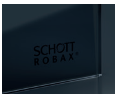
Logo in modern black*

ROBAX® NightFlame ist mit folgenden Dekorationsfarben erhältlich: