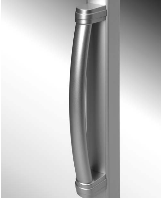
SCHOTT Griff .