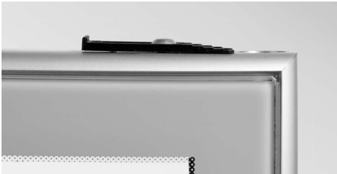
SCHOTT Termofrost® ECO-Clear AGD.