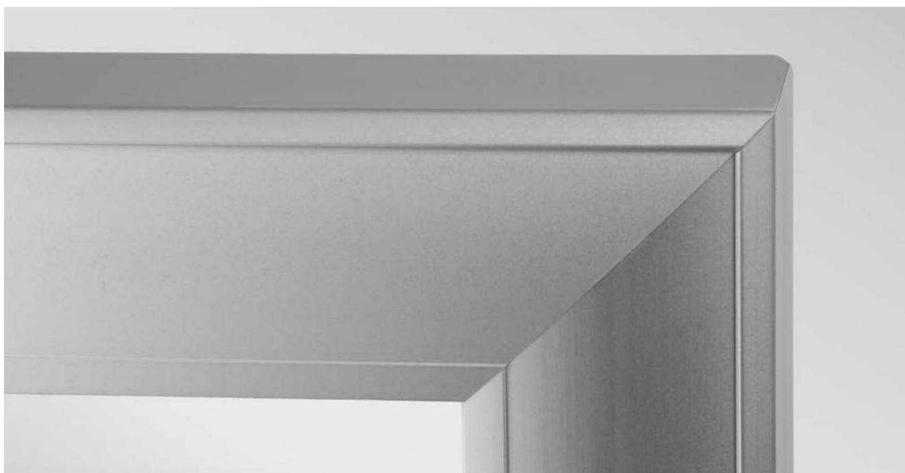
SCHOTT Termofrost® ECO-Clear X.